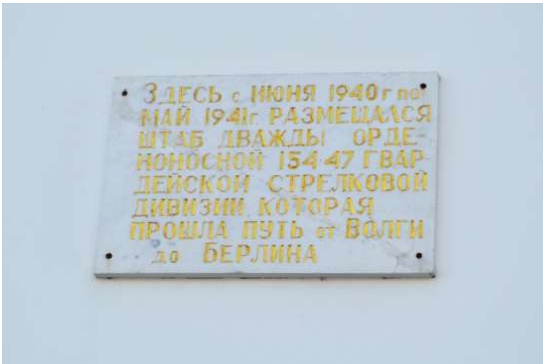
Мемориальная доска в городе Ульяновске