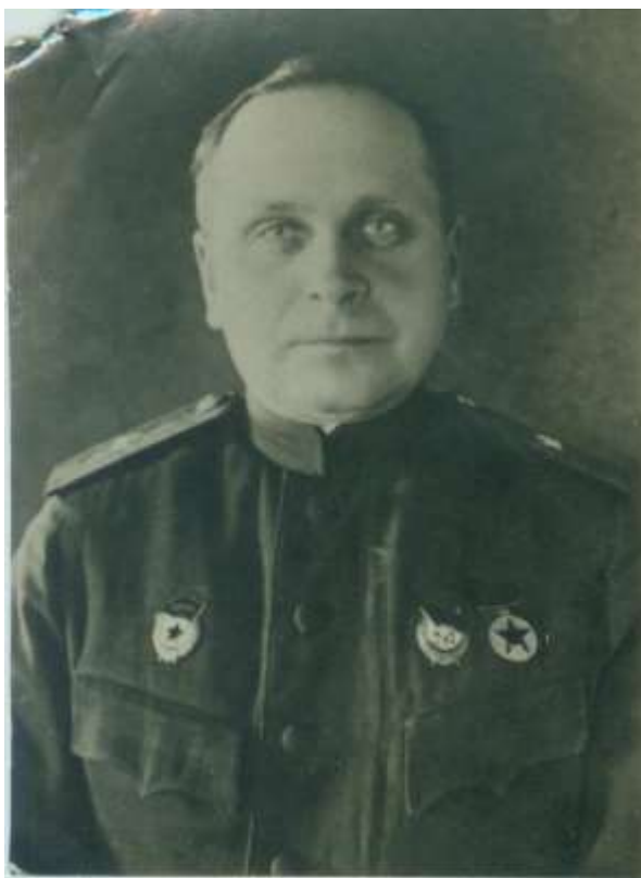
Первый командир 154 (47 гвардейской) дивизии - ФОКАНОВ ЯКОВ СТЕПАНОВИЧ